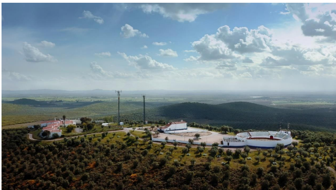
Foto – Serra S. Miguel (Capela N.S. do Carmo e Praça de Touros Pedro Louceiro)

A mais antiga Praça de Touros de Portugal e uma das mais antigas da Península Ibérica destaca-se pela sua construção tipicamente alentejana, mantendo a sua traça primitiva. Localizada no alto da Serra de São Miguel e com capacidade para cerca de 1400 pessoas, o povo afirma que foi construída durante a reconstrução da Capela de Nossa Senhora do Carmo em 1727, embora só existam registos escritos da sua existência a partir de 1860. Em 1995 foi batizada com o nome do cavaleiro tauromáquico Souselense Pedro Lemos Louceiro que tinha falecido no ano anterior.